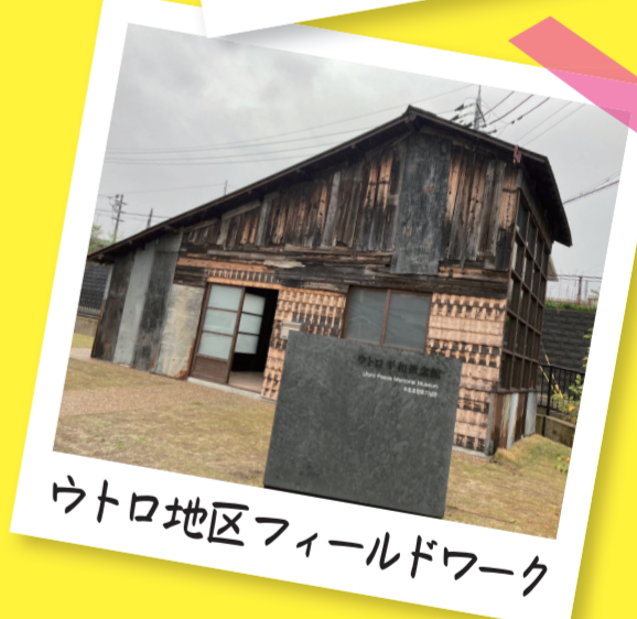
ウトロ地区フィールドワーク